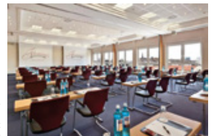
Tagungsräume des Fleming's-Hotel Frankfurt Main-Riverside

Vorstandsvorsitzender, EBZ - Europäisches Bildungszentrum der Wohnungs- und Immobilienwirtschaft, Bochum